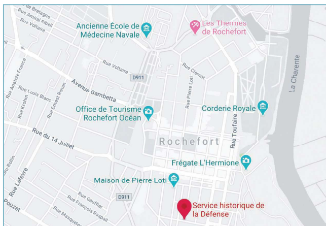
Service historique de la Défense - 4 rue du port - 17300 Rochefort

L'œuvre illustrée de l'ingénieur hydrographe Maurice Rollet de l'Isle (1859-1943), dont les rapports d'expédition et les carnets de bord ont été déposés par le Shom auprès du Service historique de la Défense à Brest, est à découvrir à Rochefort pendant toute la durée de l'exposition.